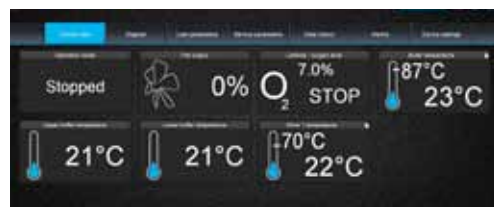
Styrning via ecoNET